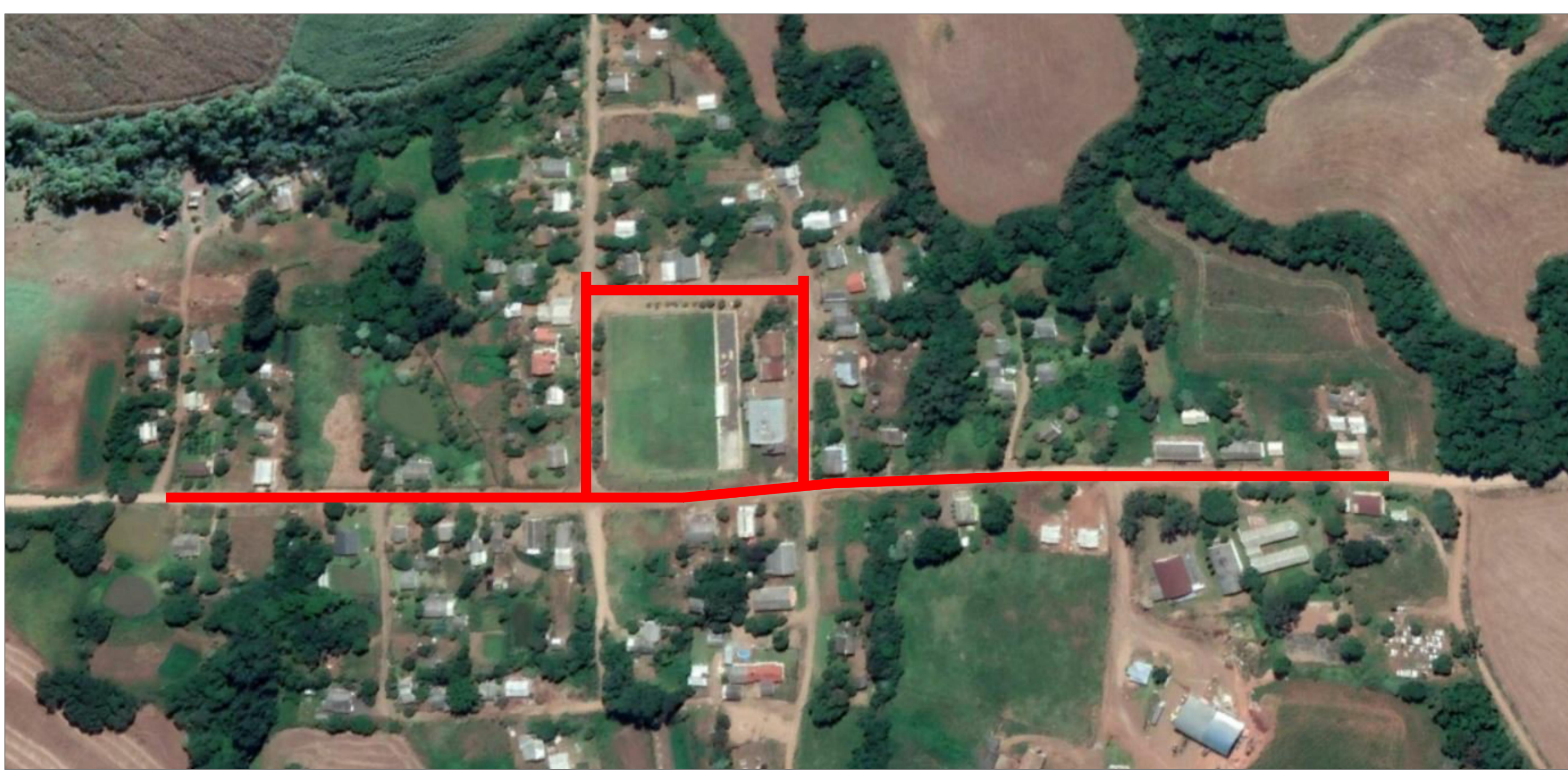
Planta de localização Esc.: Sem escala